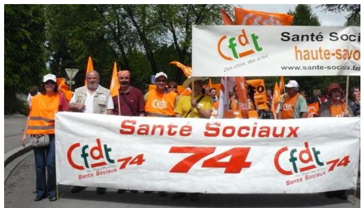
Le 1er mai festif

C'est aussi un petit hommage à tous ceux et celles qui s'investissent au nom de la CFDT et des valeurs qu'elle porte.